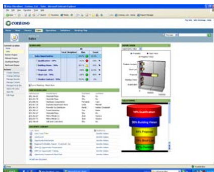
Fig. 1 – Fácil personalización de la vista por función o puesto.

Como producto de Microsoft Office, Business Scorecard Manager permite a los empleados generar, administrar y utilizar sus propios cuadros de mandos, informes y recursos visuales mediante herramientas familiares. Con estas herramientas, los empleados pueden analizar las relaciones entre los indicadores clave de rendimiento (KPI) y los objetivos empresariales tangibles.