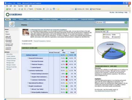
Fig. 2 – Defina y articule fácilmente su estrategia empresarial.