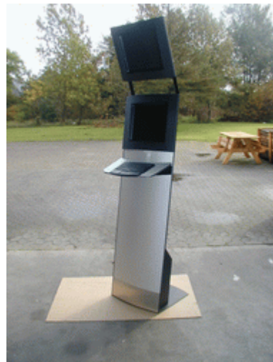
Una de las características de los modelos de la Serie TK-400 es su versatilidad. Hay una versión sin base para suelo preparada para colgar en pared y otra que incluye un segundo monitor TFT